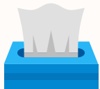
Mouchoirs en papier usagés